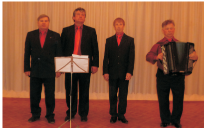
Участники 2 этапа конкурса ансамбль «Рябинушка»

По итогам первого конкурса 3 песни набрали наибольшее количество баллов.