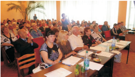
Жюри конкурса «Песни России»

В феврале 2011 года в музыкальной гостиной Юговки стартовал новый проект «Песни России», рассчитанный на весь год. Это песенный конкурс, победители которого не музыканты и исполнители, а песни. Именно за них голосуют гости музыкальной гостиной.