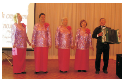
Участники 3 этапа конкурса вокальная группа "Россиянка"

Диплом I степени получил ансамбль «Рябинушка» за песню «Победа остается молодой» муз. Гаврилова, сл. Шаферана.