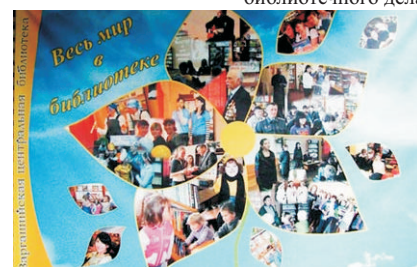
Плакат созданный коллективом Центральной библиотеки р. п. Варгаши