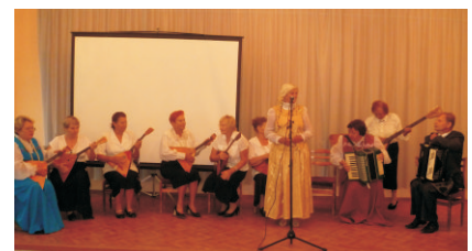
Участники 3 этапа конкурса ансамбль «Ладушки»

В итоге жюри выбрано 3 песни, которые набрали наибольшее количество баллов.