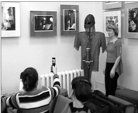
Гостям понравилось фотографироваться на фоне кольчуги, изготовленной шадринскими кузнецами