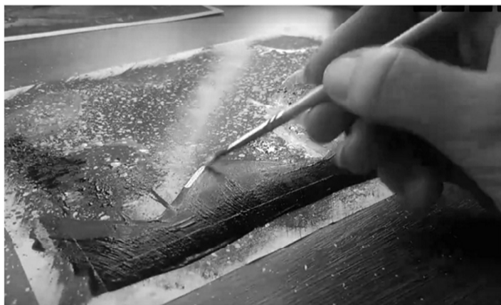
Рисуют в библиотеке им. Толстого.