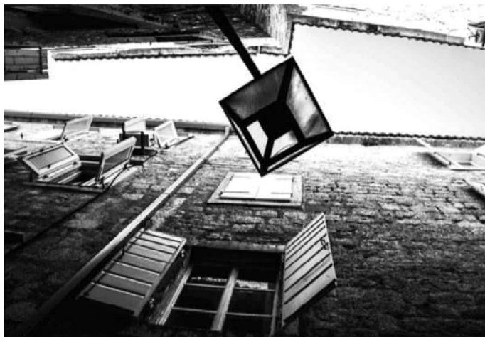
Фото Павла Козина, г. Озерск. ЛИНИЯ ВЗГЛЯДА.

Режим самоизоляции стал неожиданностью для всех библиотек. Да что там библиотек – для города, России и многих стран мира. Как работать в условиях, когда все закрыто? Дистанционно.