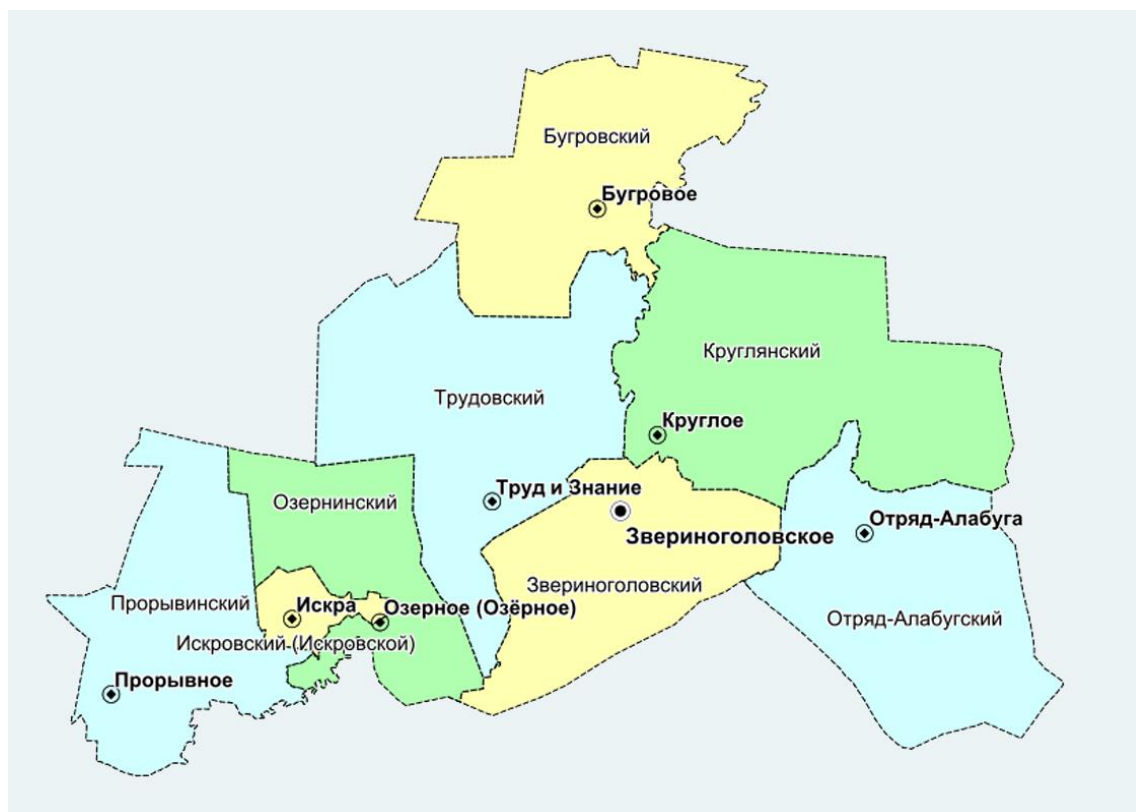
С. Зверинооголовское (районный центр)