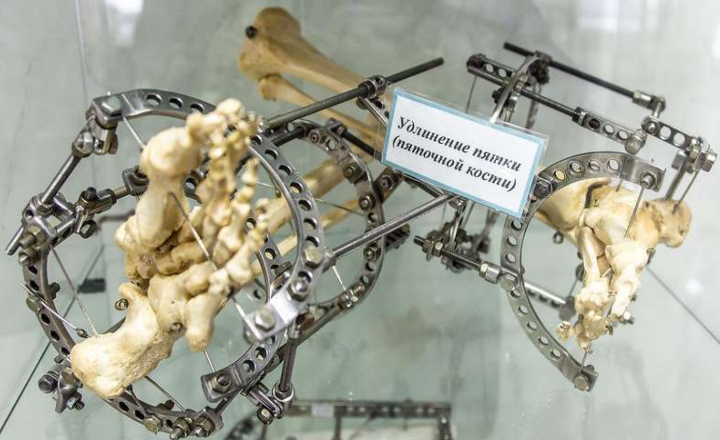
Удлинение пятки (пяточной кости)