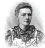
Faithfully yours E. Gaskell

11 – ВОЙНИЧ ЭТЕЛЬ ЛИЛИАН (1864-1960) – 150 лет со дня рождения. Англо-американская писательница, композитор. Создательница самого романтического образа революционера. Произведения писательницы: «Овод»; «Прерванная дружба»; «Сними обувь твою»; «Джек Реймонд»; «Оливия Лэтам».