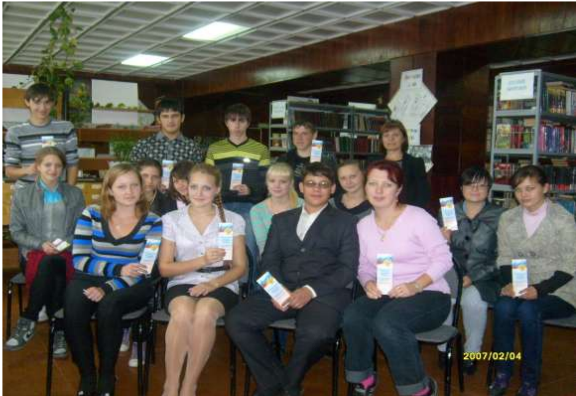
Старшеклассники на мероприятии в библиотеке.