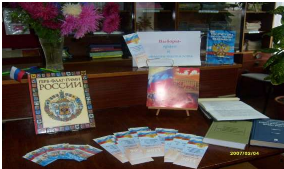
Книжная выставка «Выборы – право и ответственность».