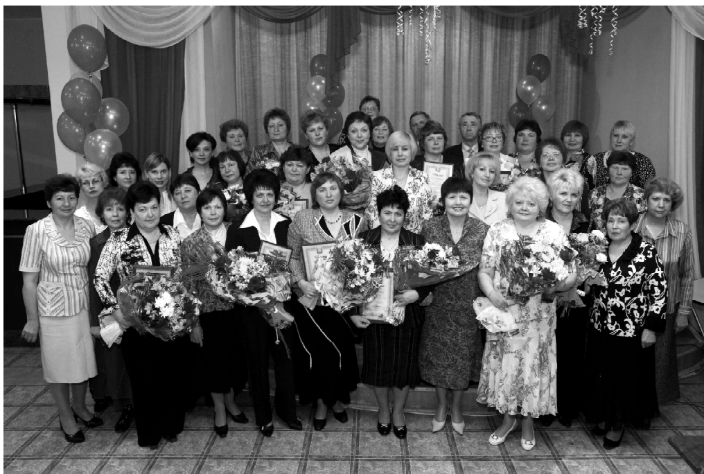
Участники и победители конкурса «Библиотека года 2008»

На территории Курганской области действует более 600 государственных и муниципальных «книжных храмов». Конкурсы и смотры дают значительный инновационный эффект, повышая социальный статус их участников. Библиотекари показывают уровень своего профессионализма, творческий потенциал коллективов. Кроме того, конкурс – это источник дополнительного финансирования. По итогам конкурса за успехи в профессиональной, творческой и общественной деятельности библиотек присуждается областная премия в денежном эквиваленте.