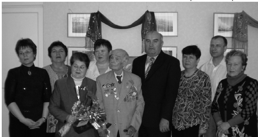
Десант из Притобольного района в Юговке