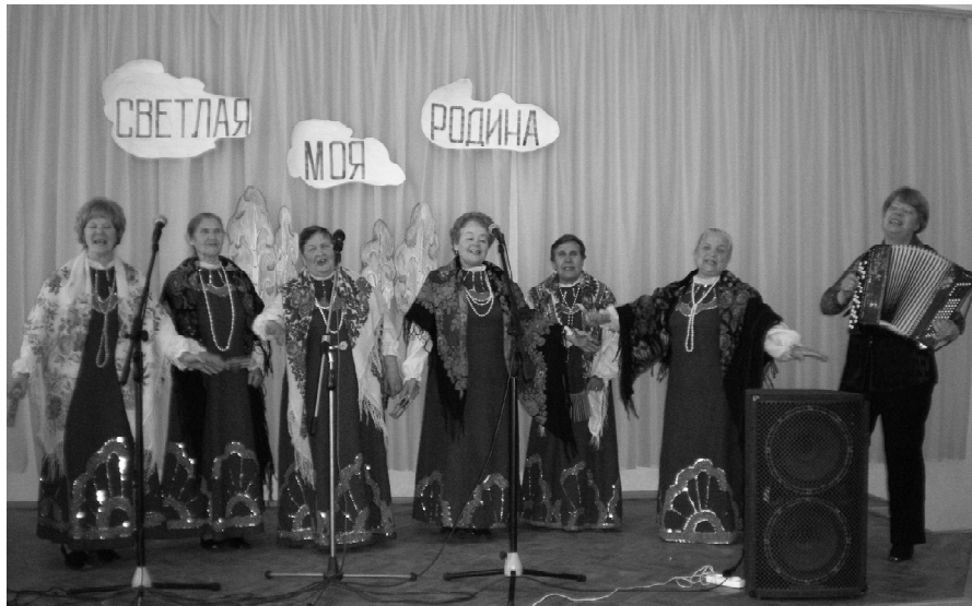
Выступает фольклорная группа «Калинушка»