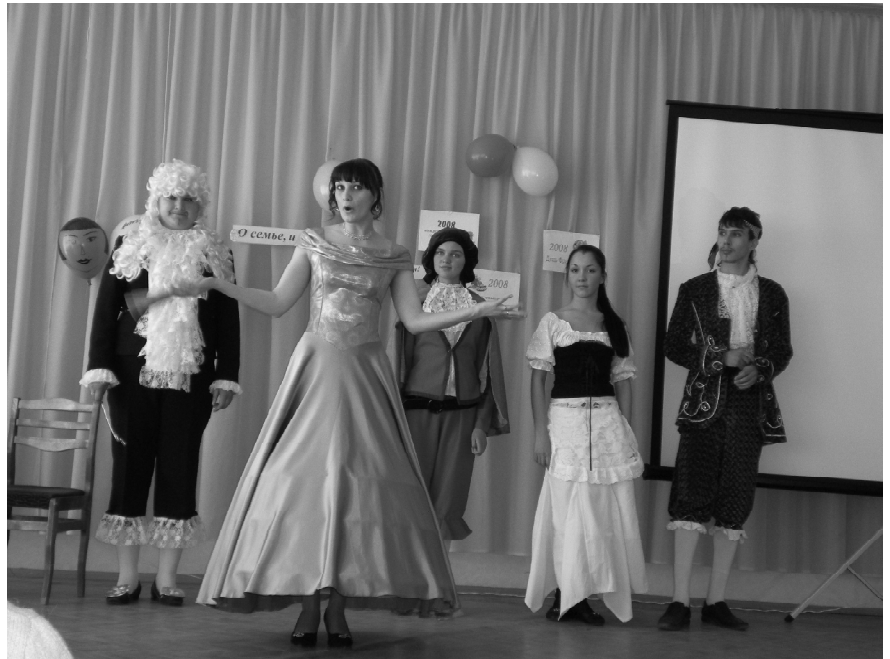
На сцене Юговки - пьеса Бомарше

дробности о династиях Брюлловых, Бенау, Фаберже, Петипа, Клер, об их творческой жизни, научном и культурном наследии.