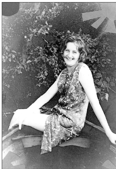
1967 год. «Я на лодочке катаюсь...»

Мы поддерживаем самые теплые отношения без малого 40 лет. Не пом-