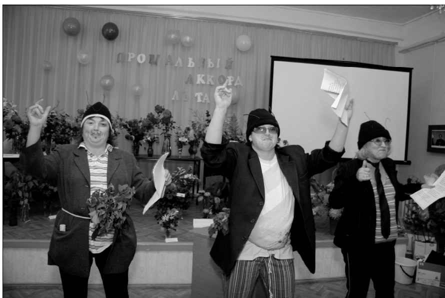
Наши «Колорадские жуки»

рэп-группа «Колорадские жуки»! Даже после праздника все восхищались. Коллектив, ведь было же интересно? И будет, что вспомнить на пенсии. Давайте разнообразить свою жизнь яркими событиями, «чтобы не было мучительно больно за бесцельно прожитые» дни.