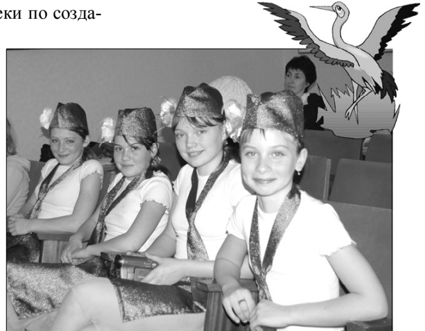
Участники форума детского экологического движения «Журавлик»

Мы считаем вклад ЦЭКиИ Юговки в систему экологического образования и воспитания детей и молодежи, в экологическое информирование и координацию усилий всех организаций, направленных на улучшение экологической ситуации в конкретной местности, в повышении экологической культуры населения весьма важным и значительным.