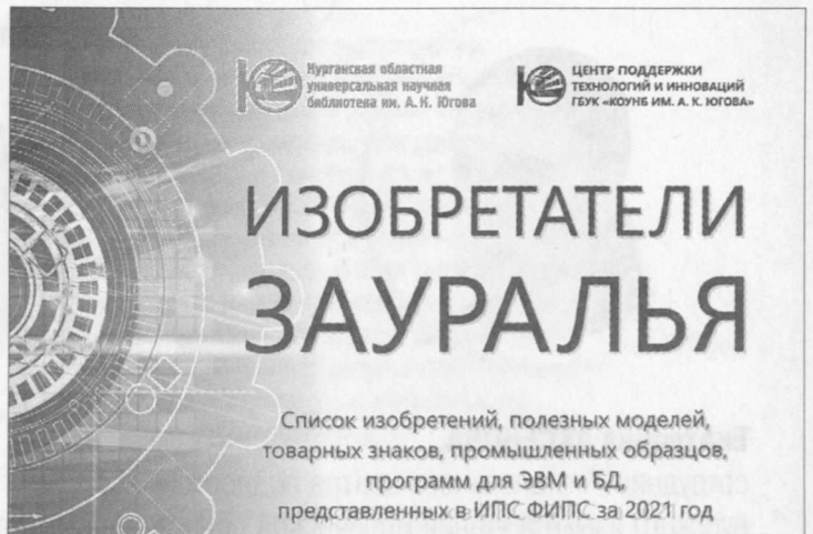
▲ Ежегодно по материалам ФИПС специалисты Центра составляют реестр региональных изобретений, полезных моделей, товарных знаков и электронных программ