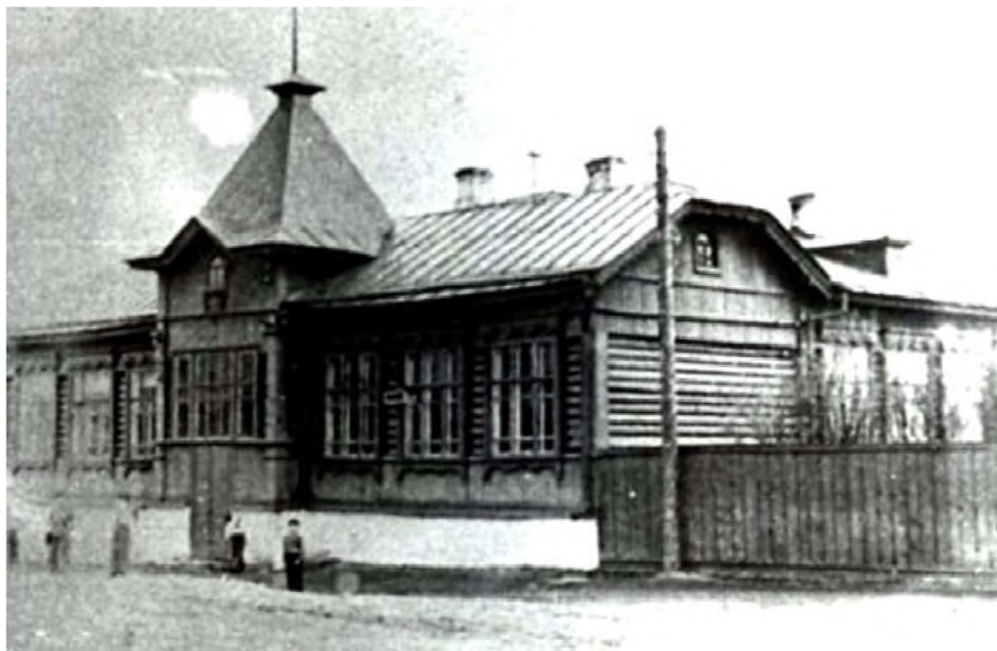
Старое здание школы № 29

«Школьные годы чудесные, С дружбою, с книгою, с песнею, Как они быстро летят! Их не воротить назад»