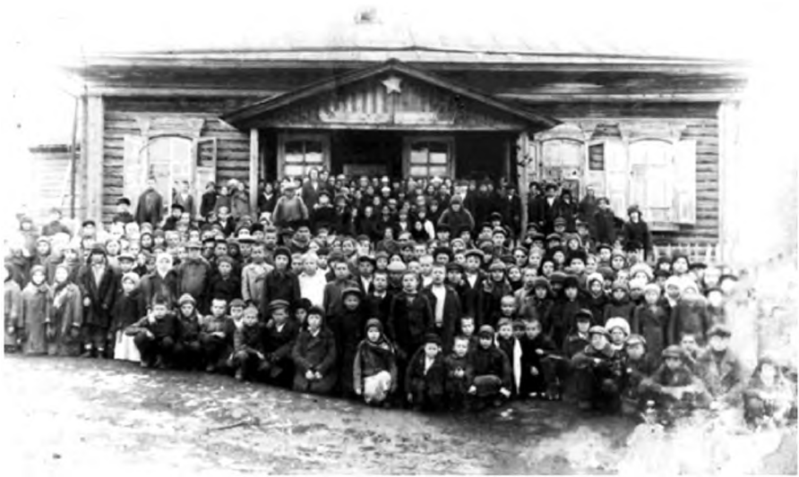
Ученики Кислянской 7-летней школы. Довоенное фото

· Педагогические коллективы школ Южного Зауралья пополняются за счет приезда квалифицированных педагогов из оккупированных областей;