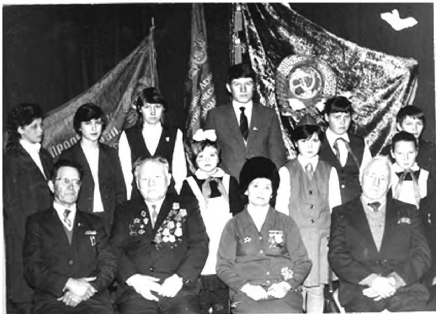
1986 год. Встреча выпускников довоенных и военных лет с лучшими учениками школы