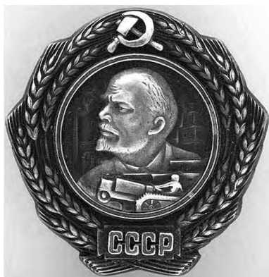
Орден Ленина довоенного образца

Недаром в числе первых учителей Советского Союза она была награждена орденом Ленина – высшей наградой