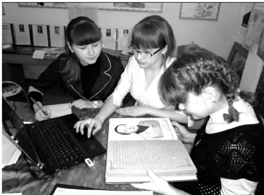
Книгу о выпускниках и учителях военного времени создавали выпускники сегодняшнего поколения...

Мы читали строки воспоминаний и осознавали, что это ценнейшие сведения, которые мы смогли услышать сквозь время из уст детей войны.