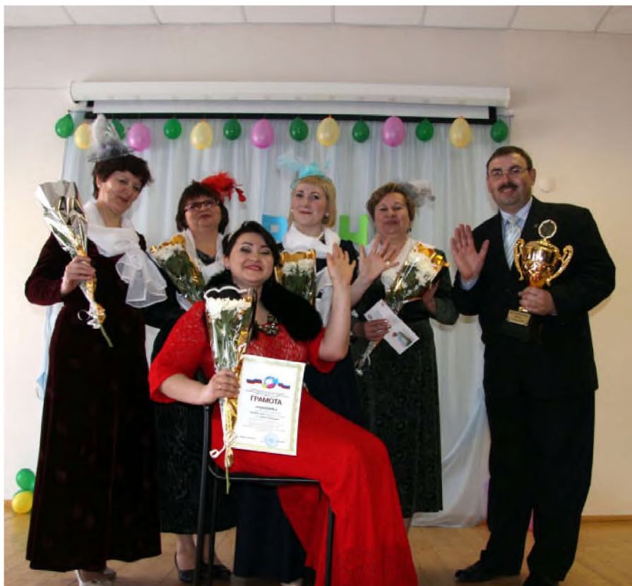
Педагоги тоже играют в КВН. Команда Щучанского района. Классные дамы и кавалеры