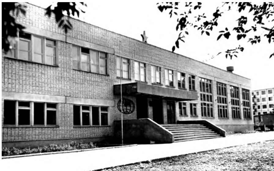
Новое здание школы № 29

Любимый город с большими улицами и маленькими улочками, переулками, тупиками, милыми двориками, новостройками, парками и скверами... Где бы мы ни были, куда бы ни забросила нас судьба, мы будем всегда вспоминать о тебе с любовью. Ты вдохновляешь нас, лечишь и поддерживаешь, ты просто любишь нас!