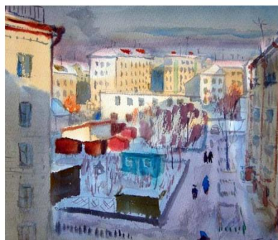
Травников Г. А. Курган (эскиз). 1970.