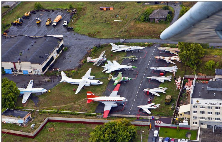
Курганский авиационный музей.