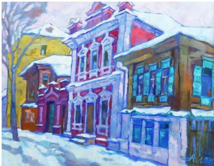
Алексеев Э. К. На Дворянской. 2014.