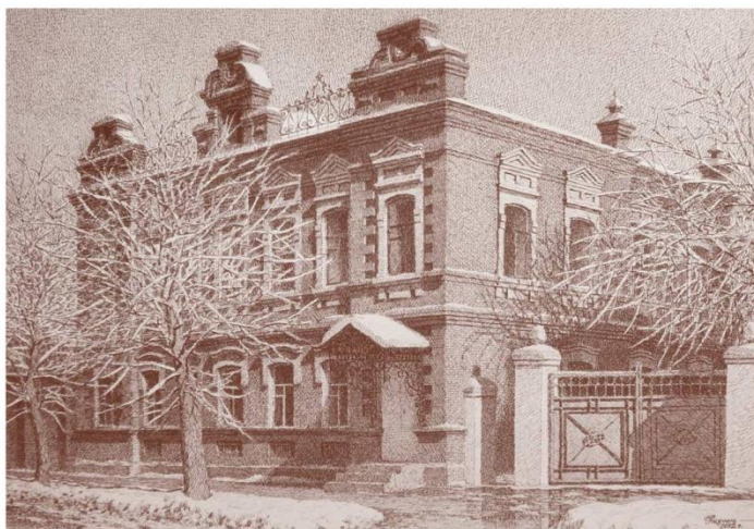
Якушина Н. С. Дом М. Т. Галямина.