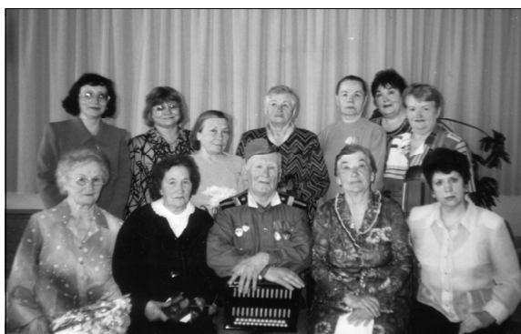
В день вручения ветеранам библиотеки юбилейной медали в честь 60-летия Победы в Великой Отечественной войне

В октябре, в День пожилых людей, библиотека тепло встречает ветеранов. Их ряды пополни-