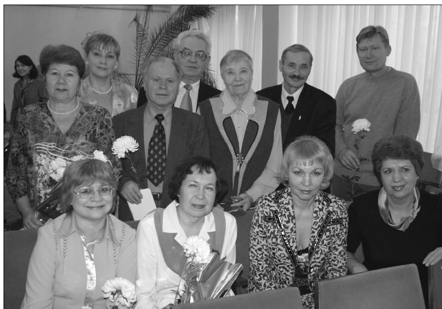
В день награждения

Одним из памятных событий прошлого года стало вручение медали «К 100-летию со дня рождения М.А. Шолохова», учрежденной Российской Муниципальной Академией за значительный личный вклад в развитие культуры, литературоведения, журналистики, краеведения, архивного и музейного дела. Ею отмечены как российские, так и иностранные граждане - деятели культуры, спонсоры, меценаты, проявляющие постоянную заботу о возрождении социально-культурного наследия России.