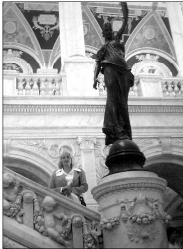
В библиотеке Конгресса США

очень сильно в социологическом аспекте: подросткам, работавшим в библиотеке в течение года, перечисляется 3000 долларов на специальный счет. Например, эти деньги могут использоваться на учебу в колледже. В дальнейшем участие в волонтерском движении засчитывается и при приеме на работу, продвижении по профессиональной лестнице. Волонтерам выдаются бесплатные билеты на посещение национальных парков, музеев. Многие в деятельности американских библиотек организовано по-другому. Над обработкой книг они не «ломают голову», этим занимаются две библиотеки – библиотека Конгресса и OCLC в Огайо. Картоотеку статей не «набивают» - пользуясь, за определенную плату, готовыми EBSCO, BISTRO. Новые технологии приходят в каждую библиотеку независимо от того, центральная она или отдаленная.