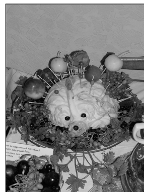
Дары лета 2005