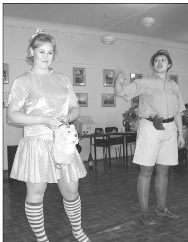
Фрагмент новогоднего концерта: "Малыши детского сада"

Жизнь коллектива библиотеки в том числе и праздники. Многие из них стали доброй традицией потому, что это не только возможность собраться вместе, сказать добрые слова друг другу, посидеть за общим столом, послушать хорошую музыку, потанцевать. Праздничная атмосфера в неформальной обстановки, дает возможность коллективу сплотиться, оценить новые грани личности каждого.